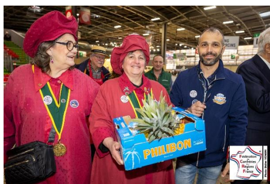
Porteur de bons produits