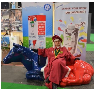
Un peu d'humour