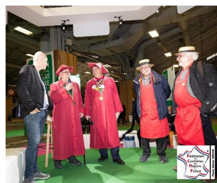
Avec nos amis du Coteau de Jouannes